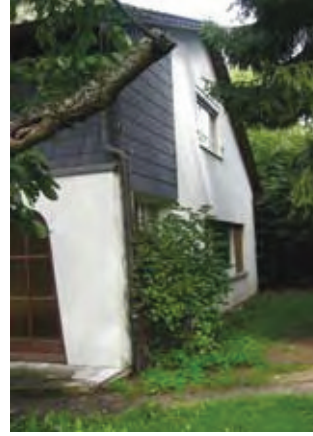
Neues und altes Erscheinungsbild des Wohnhauses